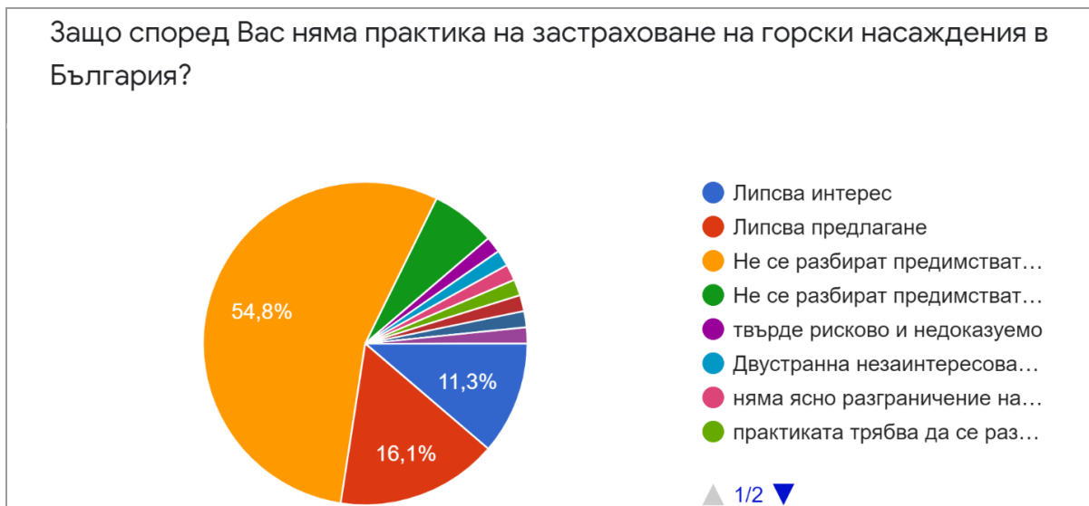
Фигура 5. Причина за липса на практика на застраховане на горски насаждения в България

Фигура 5 показва, че най-голямата част (55 %) от анкетирания експерти смятат, че липсва интерес към „горската застраховка“ в България, защото не се разбират предимствата на продукта. От една страна това може да се тълкува като проява на недостатъчно висока застрахователна култура на мениджърите, управляващи горските територии – държавна собственост, а от друга страна се срещат и изненадани разпространители, които тепърва научават за наличието и възможностите на „горската застраховка“. Трети смятат, че липсва предлагане.