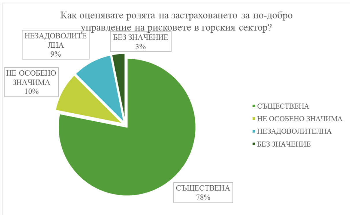
Фигура 1. Отговори на анкетираните за ролята на застраховането за по-добро управление на рисковете в горския сектор.

В отговорите на посочения въпрос, целящ получаването на една обобщена експертна оценка, се откроява мнението на експертите, че застраховането има своята роля в горския сектор, както и че тя е съществена. Този резултат е обнадеждаващ за настоящото изследване, защото демонстрира както потенциал за развитие на застрахователната услуга, така и подчертан интерес от страна на разпространителите (застрахователни брокери), за активното им участие в процесите на управление и трансфериране на риска от горския сектор към застрахователите. В проучването се посочва необходимостта от сериозна и мащабна информационна кампания за задачите на сектора и алтернативите за тяхното решаване. С отговорите на въпроса е засвидетелстван интереса на разпространителите, но той е твърде общ. „Горската застраховка“ сама по себе си е сложен, дори екзотичен застрахователен продукт без практики на използване в нашата страна, както от разпространители, така и от застраховани. Разпространителите са тези, които ежедневно търсят възможности за реализиране на продуктите си, като те винаги са ориентирани към продажбата. Всеки професионален брокер поставя интересите на клиентите си на първо място, като е в готовност да ги защитава през целия застрахователен период. Водещо в