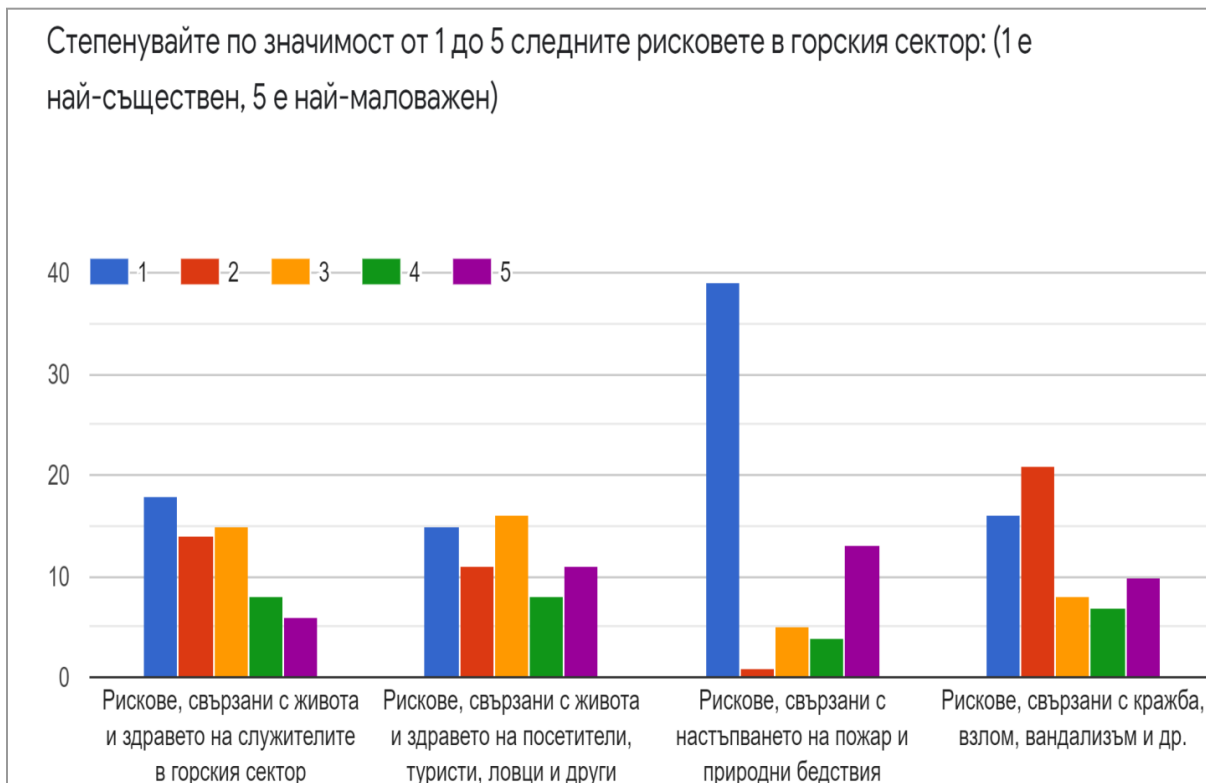
Фигура 4. Степенуване по значимост от 1 до 5 рискове в горския сектор (1 е най-съществен, 5 е най-маловажен)

Сериозно е предимството на „горската застраховка“, защото освен защита от горски пожари, чрез нея би могло да се осигури и защита от рискове срещу кражби и настъпили вреди, в резултат на природни бедствия, като буря, измръзване, осланяване и др.